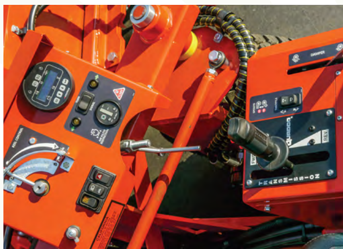
* Imágen referencial