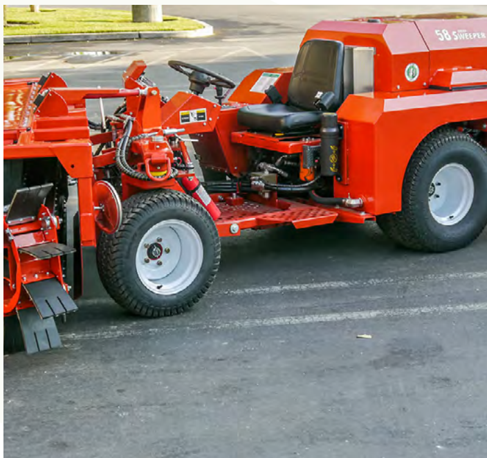
* Imágen referencial