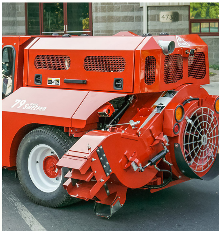
* Imágen referencial